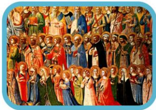
ALL SAINTS DAY