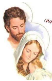
Ngày 19/03 - Lễ kính Thánh Giuse Bạt trăm năm Đức Maria

Để khẳng định lại tính phổ quát của sự bảo trợ của thánh Giuse đối với Giáo hội, ngoài những dịp đã nói ở trên, Tòa Ân Giải Tối Cao ban Ơn Tòa Xá cho các tín hữu sẽ đọc bất kỳ lời cầu nguyện đã được phê