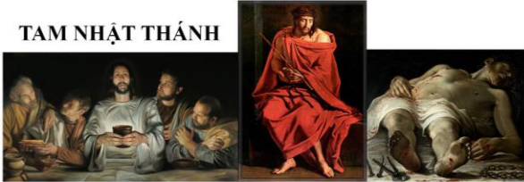
TAM NHẬT THÁNH