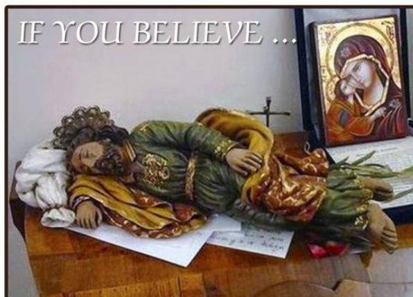
Pope Francis showed the sleeping posture of St. Joseph's statue he keeps on his desk in Roma, during the "Meeting with Families" held at the Mall of Asia Arena in Manila, on 16 January 2015. The pope spoke of his devotional practice of writing prayer requests on pieces of paper and slipping them under the statue, invoking St. Joseph's intercession.